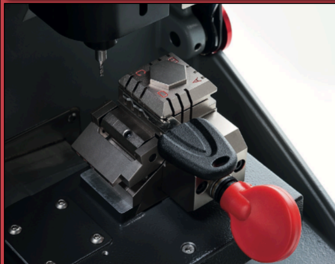
锯齿形汽车钥匙专用夹具